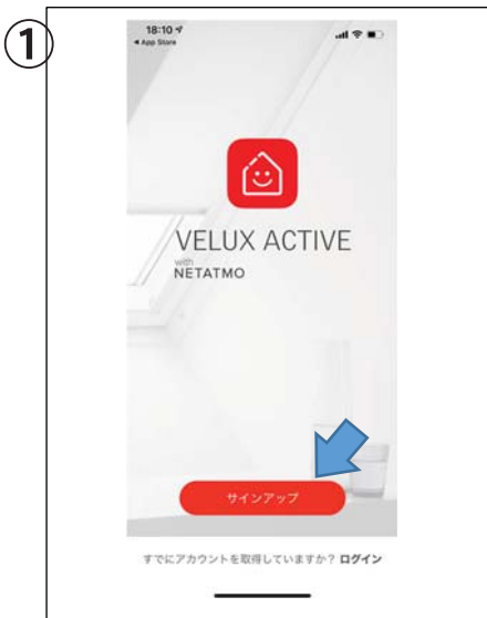
招待を受けるスマホにアプリをダウンロードして、「サインアップ」します。