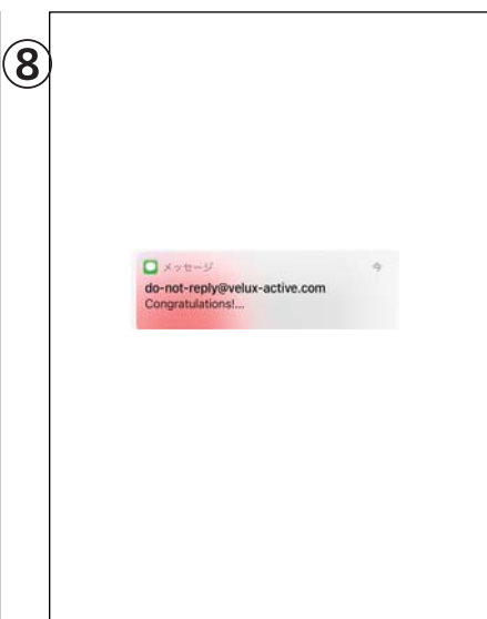
登録完了のメールが届いたら、アプリを開きます。