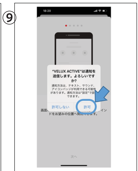
通知を許可して接続完了です。最後に、ゲートウェイとスマホを近づけ、認証を行うと天窓が操作できるようになります。