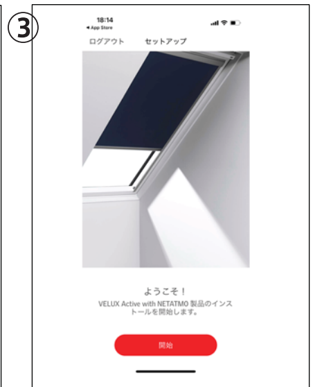
サインアップ完了です。ここで起動中のアプリを一度終了して待機します。