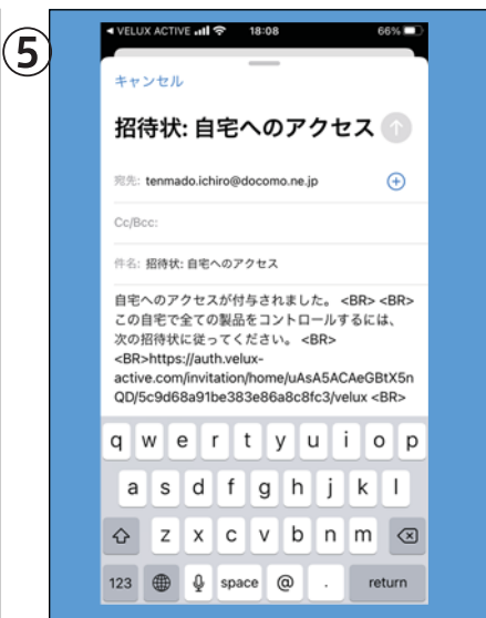
招待するスマホのメールアドレスを入力して送信します。