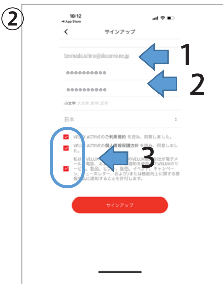
スマホのメールアドレスを入力し、パスワードを設定して、全て☑したら、サインアップを押します。