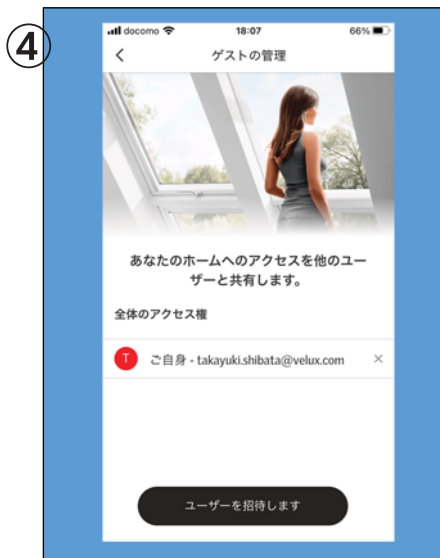
マスターのVELUX アプリにて、「設定」から「ゲストの管理」を開き「ユーザーを招待します」を押します。