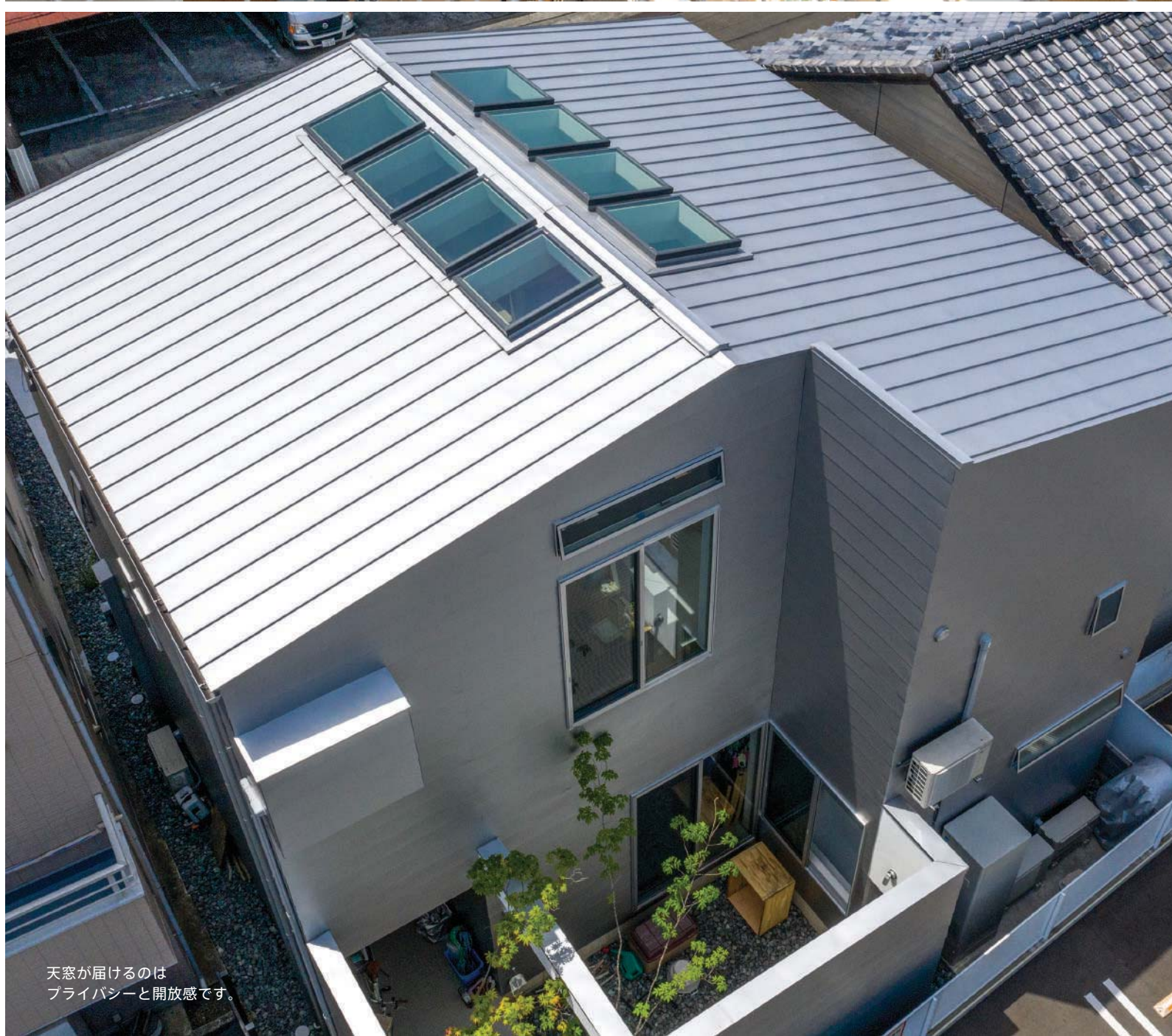
天窓が届けるのは プライバシーと開放感です。