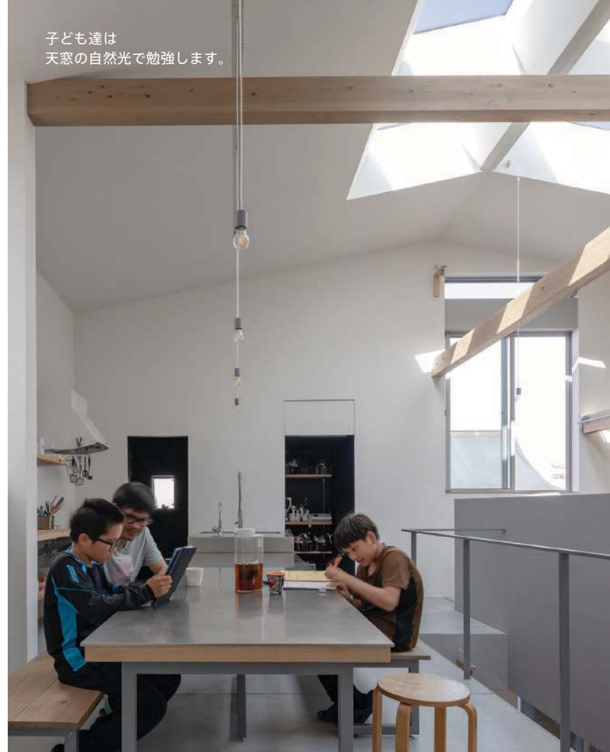
子ども達は 天窓の自然光で勉強します。